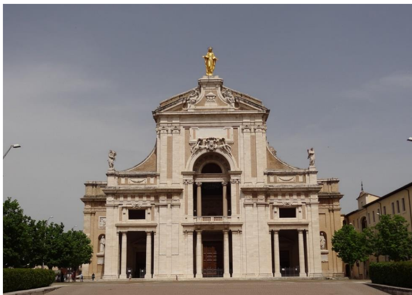
Basilica Santa Maria degli Angeli - Assisi