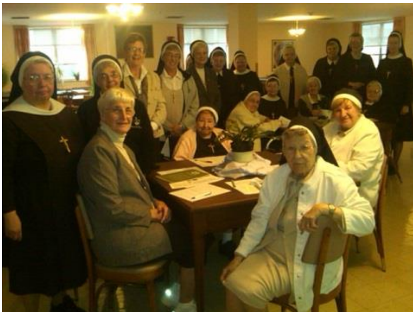
Les Sœurs dans le New Jersey s'apprentent à signer la Promesse de saint François pendant l'atelier d'éco-spiritualité.

Pour accepter la responsabilité que nous avons de prendre soin la terre de manière à diminuer les effets nocifs des pratiques humaines, nous devons modifier notre mentalité et notre mode de vie au quotidien. Il faut non seulement transmettre ce message à ceux que nous servons, il est essentiel aussi que nous, les sœurs, adhérions à cet appel à être des gardiens de l'environnement aux niveaux de la congrégation, de la province et à titre personnel. Au 23 ème Chapitre général de 2012, ont été confirmés les objectifs du Bureau de la Congrégation 'Justice, paix et intégrité de la création', notamment : «Le plaidoyer pour le respect de la création et la gestion responsable de l'environnement.»