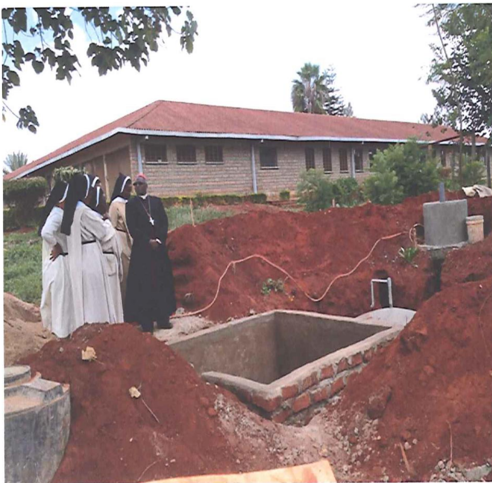
Projet de biogaz; Maison de formation des Sœurs Féliciennes, Kenya, Afrique

Ces mesures ne sont qu'un début du travail à faire pour devenir de meilleurs gardiens de l'environnement, il faut faire bien plus. Le plus grand défi, ce sont les changements personnels nécessaires pour réduire notre empreinte carbone, en tant qu'individus et en tant que congrégation. Dans la mesure où nous travaillons pour réaliser ces changements, le respect de la création peut être promu au sein de nos ministères et auprès de ceux que nous croisons tous les jours. C'est une belle façon de stimuler l'Église et le monde à prendre soin de la terre!