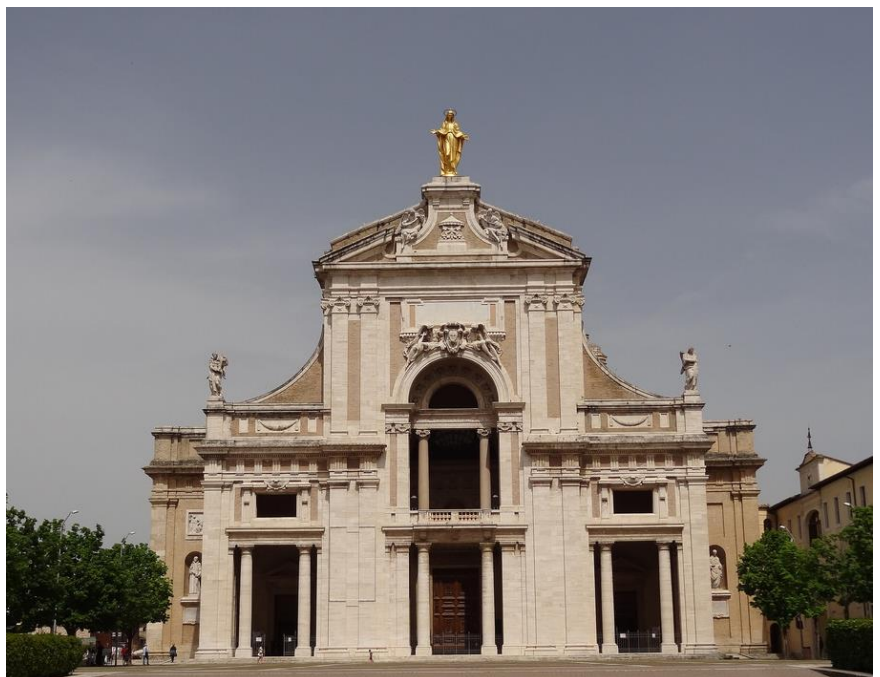
Basilica Santa Maria degli Angeli - Assisi